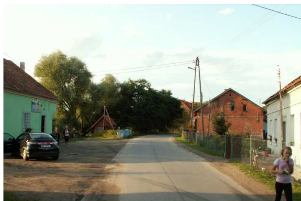
Wilimy. Pełen luz. Tu kończy się asfalt, a zaczynają lasy.