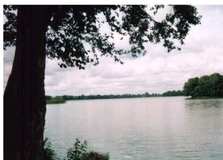
typowy nadbrzeżny pejzaż