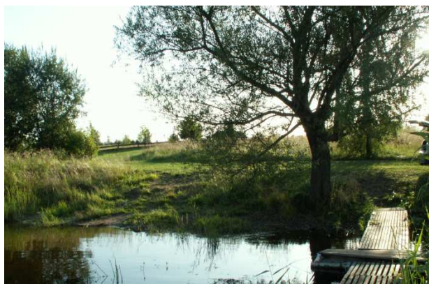
Dz.64/11, w której udział stanowi dostęp do jeziora. Szczegóły w tekście i na mapce.